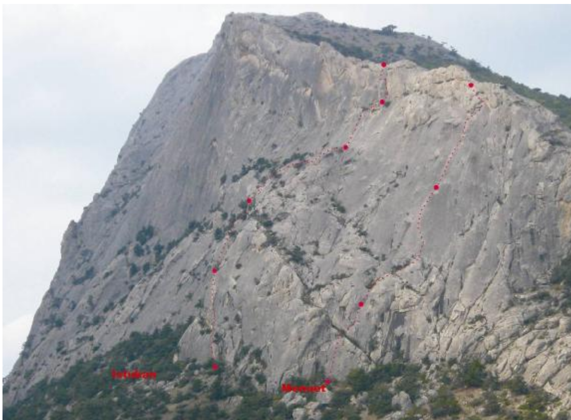
1.Pav. Sokolo uolos pietrytinis šlaitas su maršrutais Istukan ir Menuet.

Pastabos. Maršrutą lipome 2,5val., lipome po pietų, po to kai pralipome Istukan. Visas maršrutas yra tvarkingai prakaltas. Savo saugos taškų organizuoti nereikia. Lipdami neėmėme nei kaiščių, nei „Frendų“. Maršrutas šiaip lipamas 5 virvėmis, bet kadangi paskutinės 4 virvės po 30m, o mes turėjome 60m ilgumo virvę, be to lipant nesusidaro daug kampų, kurie trukdytų ištraukti virvę, tai nusprendėm paskutiniąsias virves lipti po 60m.