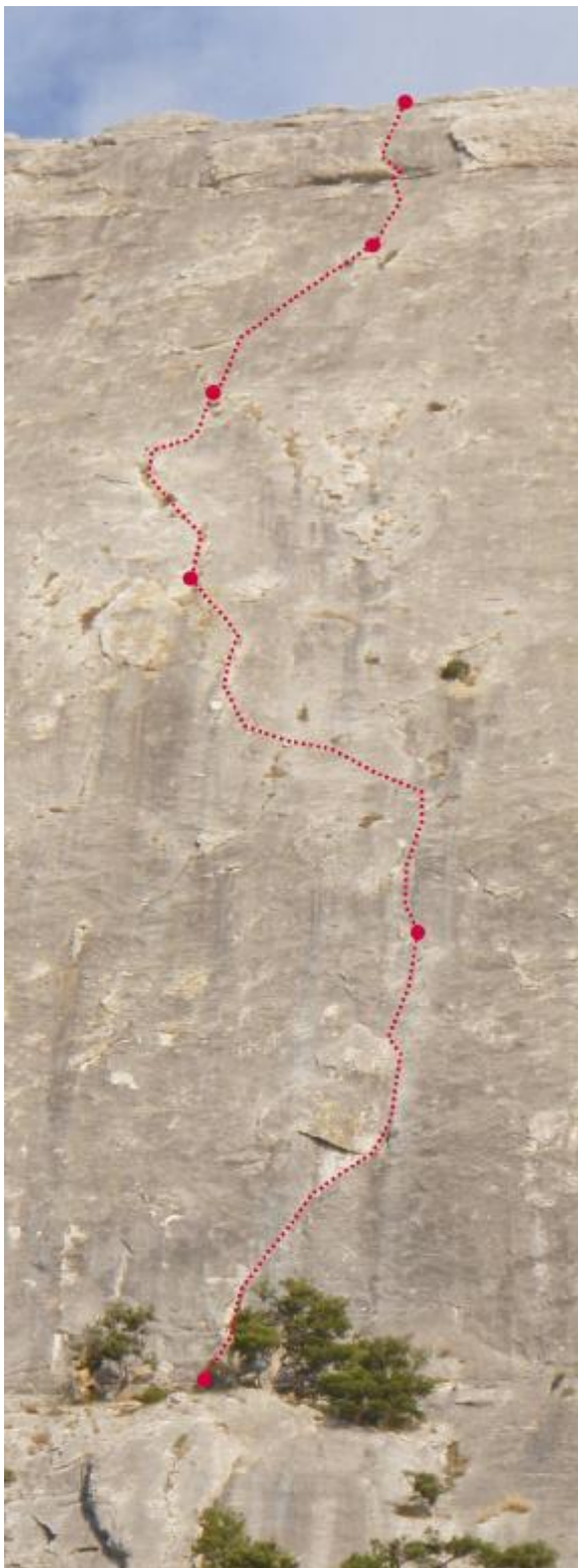
3. Pav. Maršrutas Belyj treugolnik