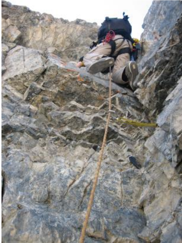
Gediminas lipa ketvirtą virvę.