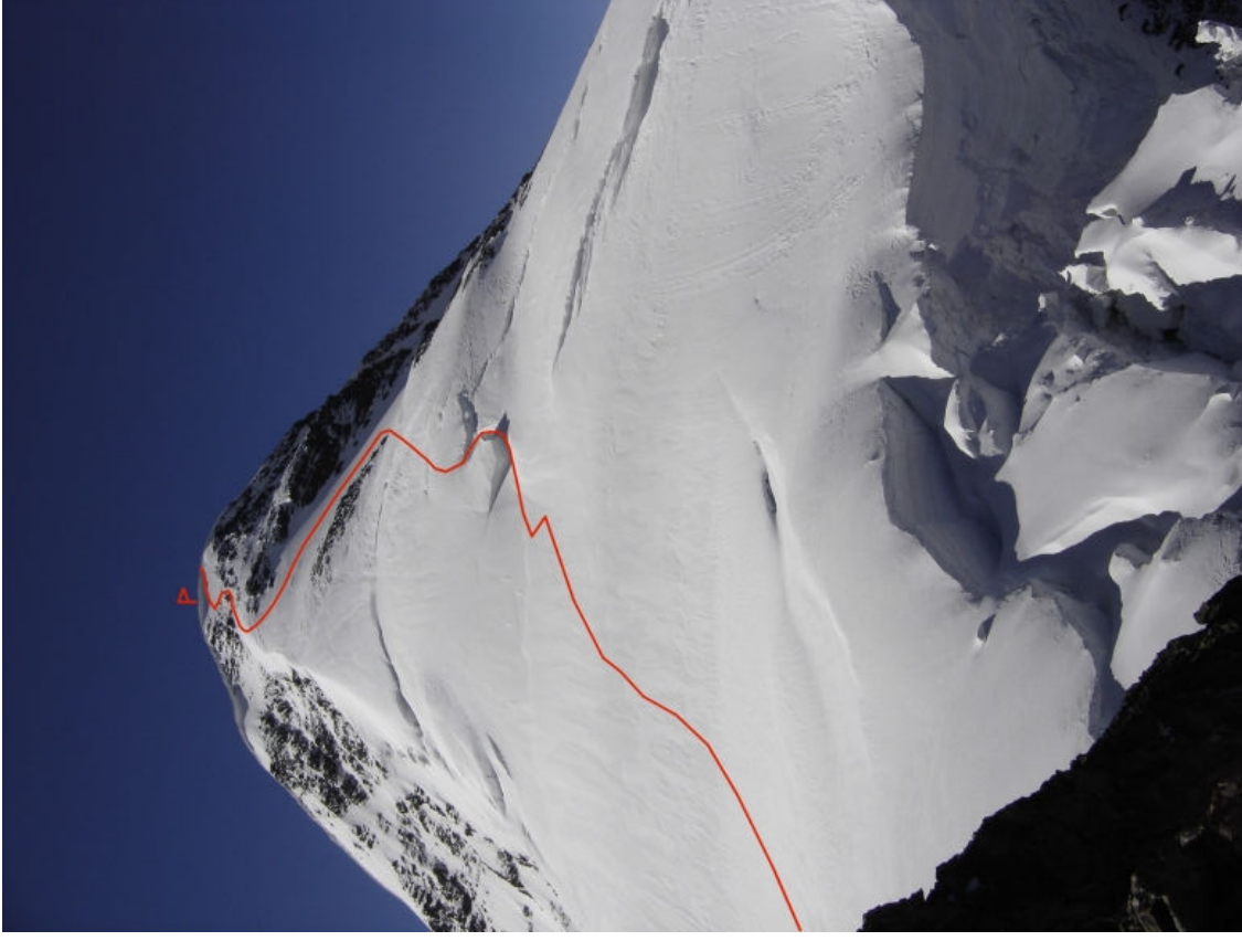
Viršutinė maršruto dalis. Fotografuota iš 4400 m. aukščio.