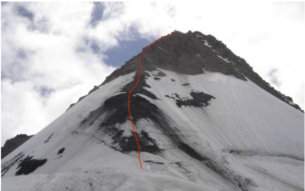
Viršūnės Ляльвер šlaitas. Fotografuota nuo perėjos Цаннер Нижний , 3900 m.

Verta paminėti, kad nusileidimo nuo Ляльвер viršūnės sąlygos neatitinka maršruto aprašymo, pateikto А.Ф.Наумов knygoje „ Центральный Кавказ “. Aprašomas snieginis šlaitas šiuo metu yra nutirpęs ir padengtas smulkia morena, o šlaito apačioje yra 70 m. vidutinio statumo kieto ledo atkarpa (taip pat padengta morena). Dėl minėto reljefo sudėtinga organizuoti saugą, yra krentančių akmenų pavojus. Todėl leistis nuo Gestolos (bei kopti į viršūnę), rekomenduotina tuo pačiu 4A sudėtingumo maršrutu.