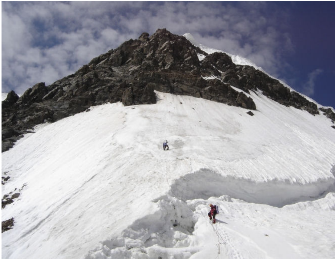
Viršutinė įkopimo į viršūnę „4310“ dalis. Aukštis 4150 m.