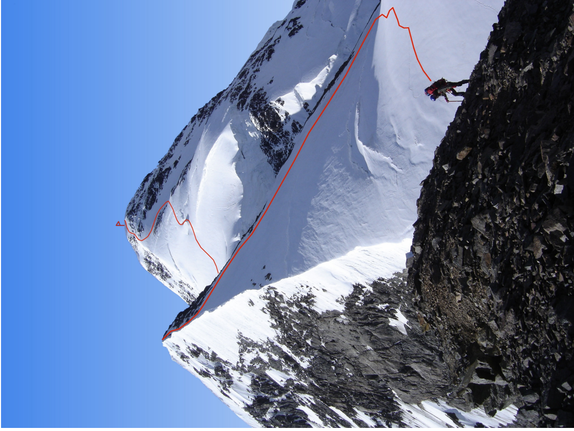
Viršūnė Gestola. Fotografuota nuo viršūnės „4310“, 4346 m.