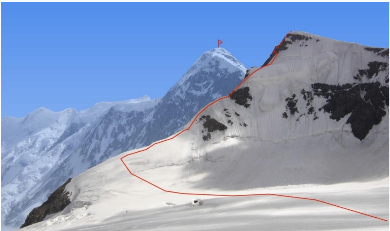
Maršrutas į viršūnę „4310“. Fotografuota nuo Черные осыпи , 3709 m.