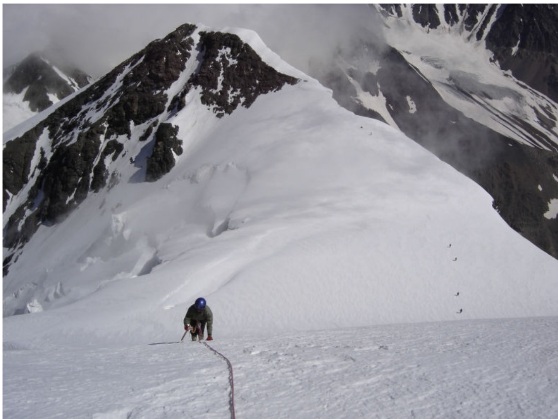
200 m. iki viršūnės Gestola. Aukštis 4650 m.